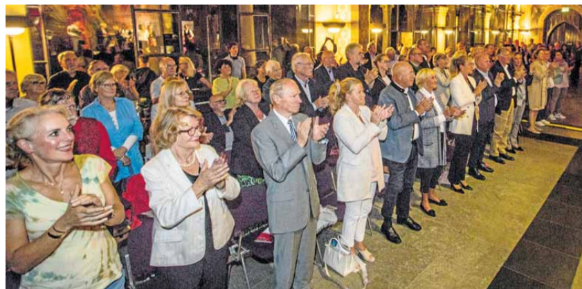
Stehende Ovationen erlebt das Tango-Konzert der Tessner-Stiftung am Samstagabend in der Pfalz – beinahe stellvertretend für so viele Auftritte des Musikfestes.